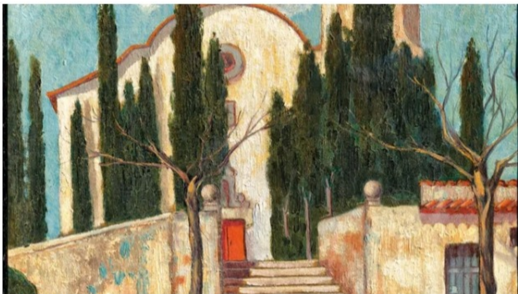
Pintura de Xavier Montsalvatge de l'església de Solius

ACN Girona - La Fundació Rafael Masó inaugura aquest dijous al vespre una exposició dedicada a l'escriptor, pintor i mecenes noucentista Xavier Montsalvatge Iglésias (1881-1921). Es tracta d'una mostra artística que es podrà visitar a la Casa Masó que busca reivindicar la figura d'aquest gironí clau en la cultura catalana d'ara fa un segle però molt poc conegut. Montsalvatge va arribar a la capital gironina el 1896, en plena adolescència, quan el seu pare va instal·lar-hi la banca familiar. Montsalvatge va ser actiu en l'àmbit literari fins el 1910, quan es va casar i es va decantar cap a la pintura, l'ebanisteria i l'exlibrisme. La mostra de la Casa Masó serà la primera que mostra les múltiples vessants que tenia l'artista.